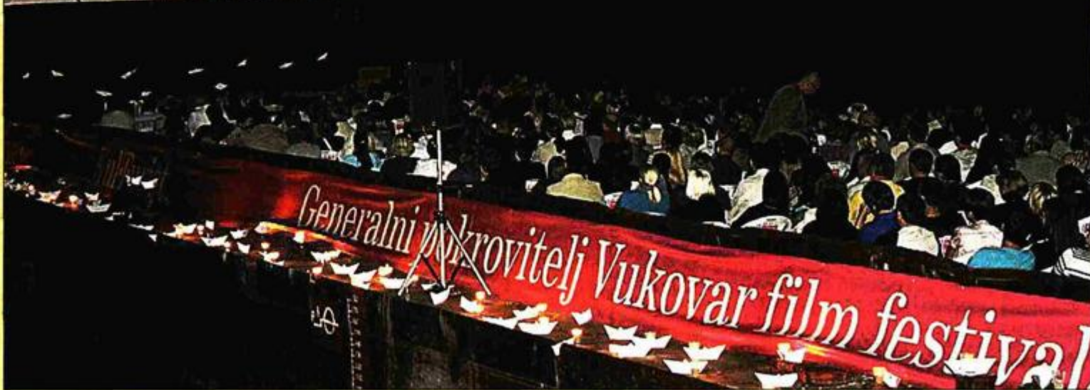
Prve godine Vukovar film festival posjetilo je 4.000 posjetitelja, četiri godine poslije čak 19.000