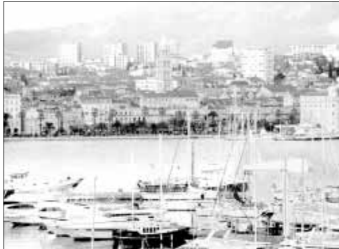
Split i Dubrovnik najčešće su isticali kao gradovi koji bi mogli predstavljati Hrvatsku

Hrvatsku u svijetu najbolje može predstaviti turizam, drži 28 posto ispitanika u anketi agencije MediaNet, dok 12 posto anketiranih vjeruje da su nam najbolja reklama nacionalna jela